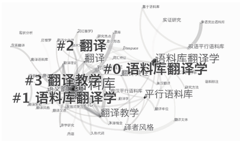
图3 1999—2018年有关语料库翻译学研究的关键词统计